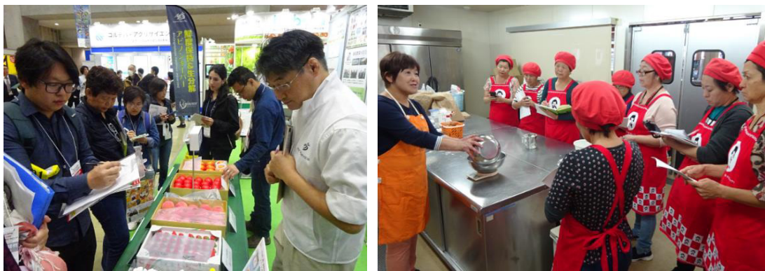
Fotos de los entrenamientos en Japón en 2019

Los detalles de los contenidos de formación se encuentran en las páginas siguientes. El contenido del entrenamiento es provisional en agosto de 2022, y puede tener algunos cambios.