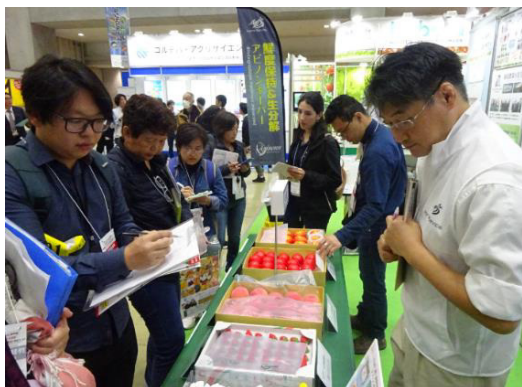
Fotos dos treinamentos no Japão em 2019