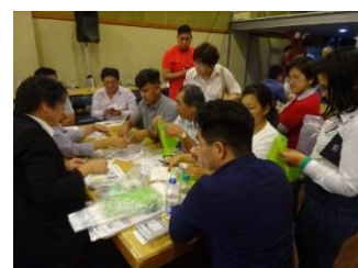
過年度事業の中南米現地視察の様子