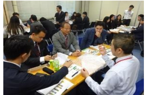
過年度事業の商談会の様子