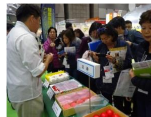
過年度事業の視察の様子