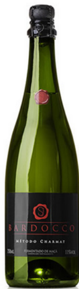
Fermentado de Maçã Bardocco 750mL Bardocco リンゴ醸造酒 750ml