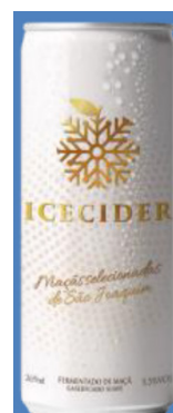
Sidra de Maçã Icecider lata 269ml リンゴシードル : Icecider 269ml 缶