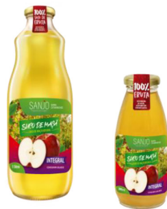
Suco de Maçã Integral Sanjo 1L e 300mL/リンゴ果汁 100%ジュース : 1L と 300ml

私たちのりんご農園は1240ha以上あり、徹底的な品質管理のもと生産を行っています。さらに、私たちのリンゴはHACCP認証も取得しており、国際基準で食料安全保障に取り組んでいます。私たちの農園は技術者チームのもと、作付けから収穫まで、常に品質と環境への配慮を考えて管理しています。