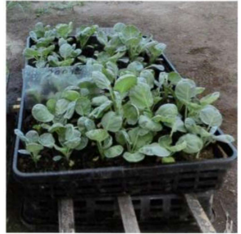
酵素を散布した方が葉の成長が良い。 Plants with 100-fold diluted enzyme solution grow bigger.