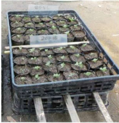
ポットの稚苗に希釈した酵素液を散布。 Sprayed with diluted enzyme solution.