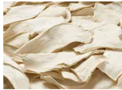
ホースラディッシュ(西洋わさび) 乾燥ホースラディッシュ(フレーク・パウダー) DRIED HORSERADISH (FLAKE, POWDER) ●産地/中国 ●荷姿/20kg × 1/カートン

本わさびと同じ辛味と風味を有しており、わさび製品の原料用途の他には、レホールとしてステーキと一緒に食べられています。