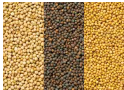
マスタード マスタードシード MUSTARD SEED ●産地/カナダ ●荷姿/バルク・45kg・PP袋 産地(カナダ)における複数の有力サプライヤーと協力的なパイプを有し、安定供給が可能です。