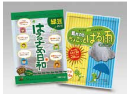
加工食品 春雨 VERMICELLI ●産地:中国 ●荷姿:各種 製造工場の契約農場産緑豆を使用し安心・安全な製品管理を徹底しています。 量販店様向けPB製品から業務用バルク、カップスープ用小分けパウチ等、用途に合わせて対応可能です。