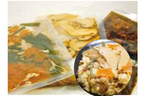
加工食品 ごはんの素他、各種味付製品 COOKED RICE MIX ●産地:中国 ●荷姿:各種 炊き込み、混ぜ込み、容量などご希望に合わせて加工致します。