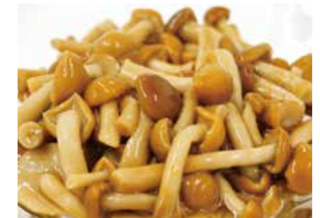
加工食品 水煮 なめこ BOILED NAMEKO MUSHROOM ●産地:中国 ●荷姿:各種 ご要望に応じてフレッシュ原料からの加工も可能です。惣菜、味噌汁具材に最適です。