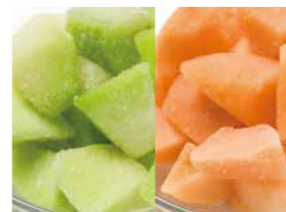
冷凍果実 メロン MELON ●産地/チリ ●荷姿/各種 ハニーデュー、キャンタローブとも取り揃えています。

食品部は、冷凍、生鮮、加工品など様々な形態の果実や野菜を取り扱っています。ヴォークス・トレーディングならではのラインナップで、お客様より高い評価を頂いています。タイ関係会社 TIMFOOD 社にて長年蓄積されたノウハウをその他国外提携先での製造にも活かし、これからも、一貫した厳しい安全品質管理体制で「オンリーワン」の商品を提供します。