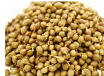
加工食品 塩蔵 山椒の実 SALTED JAPANESE PEPPER SEED ●産地:韓国 ●荷姿:各種 産地を厳選した色や風味にこだわった原料です。