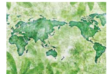
スパイス・ハーブ ソリューション SOLUTION ●産地/世界各地 契約栽培・新産地開発・コストダウン・抽出・現地加工など幅広いソリューションをご用意しています。