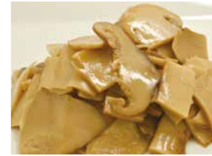
加工食品 水煮・塩蔵 松茸釜飯サイズ BOILED/SALTED MATSUTAKE MUSHROOM FOR COOKED RICE ●産地:中国 ●荷姿:各種 炊き込みご飯等に最適です。