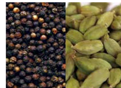
スパイス・ハーブ スパイス SPICE ●産地/世界各地 ●荷姿/各種 世界各地から調達した高品質のスパイス。選別、粗粉碎、蒸気殺菌などを行い、使いやすい状態でお届けします。