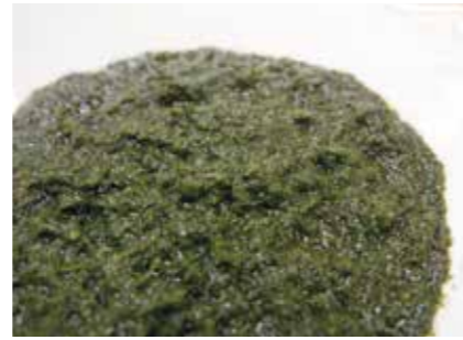
加工野菜 大葉ペースト SHISO PASTE ●産地/日本 ●荷姿/1kg×10袋/カートン 化学合成農薬不使用の大葉を使用したペーストです。