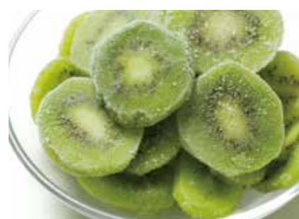
冷凍果実 キウイ KIWI ●産地/チリ ●荷姿/各種 熟度管理された商品です。