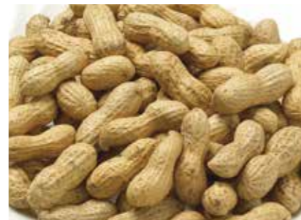
豆類 落花生 GROUNDNUTS ●産地/中国・南アフリカ等 ●荷姿/各種 大粒・小粒共に取り扱っています。