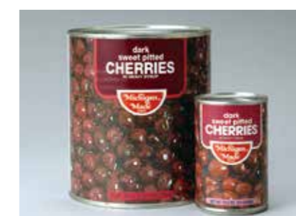
缶詰 ダークスウィートチェリー DARK SWEET CHERRY ●産地/アメリカ ●荷姿/4号缶・1号缶 各種洋菓子に最適です。