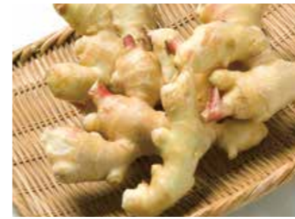
生姜 冷凍生姜加工品 FROZEN GINGER PRODUCTS ●産地/中国・インドネシア ●荷姿/10kg × 2/カートン

中国・遼寧省とインドネシアでの自社栽培・自社加工により、農業管理やトレーサビリティの保証を実現しております。