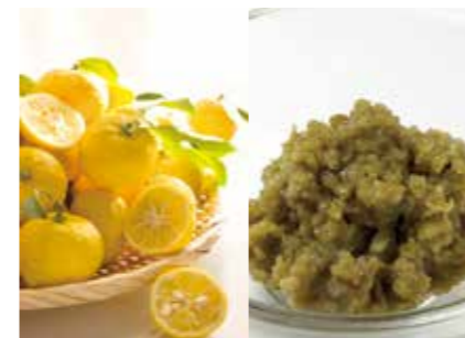
和柑橘商品 柚子、カボス等和柑橘 (冷凍果汁・オイル・果皮・柚子胡椒・液体柚子胡椒等各種商品) JAPANESE CITRUS PRODUCTS (YUZU, KABOSU ETC.) ●産地/九州産 ●荷姿/各種(20kgバルクから40gの瓶詰めまで様々) 和柑橘製品であれば、バルクから最終製品まで各種対応可能です。大分県を中心とした原料産地管理を徹底して行っています。最終製品は小ロットから対応します。