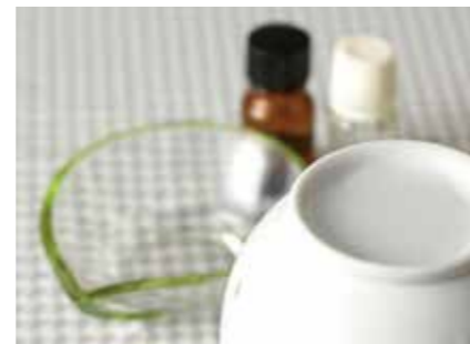
エッセンシャルオイル その他 OTHER ESSENTIAL OIL ●産地/世界各地 ホースラディッシュ、柚子他様々なエッセンシャルオイルの商品化に取り組んでいます。