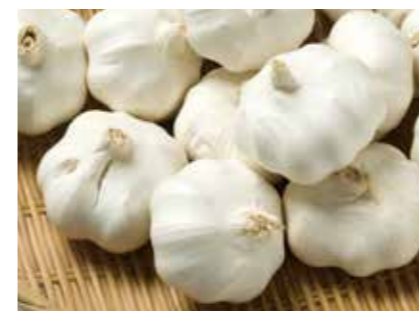
にんにく 冷凍にんにく加工品 FROZEN GARLIC PRODUCTS ●産地/中国 ●荷姿/5kg × 4/カートン

自社栽培した安心・安全な原料を乾燥・殺菌し、粉末化したものです。用途はカレーやスープ、ソース、たれ等の原料に。