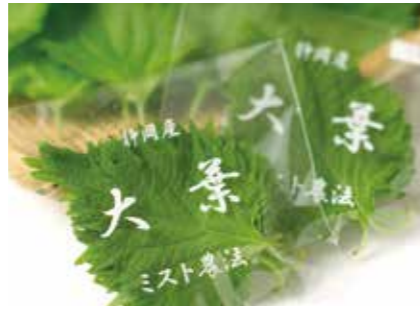
生鮮野菜 大葉 GREEN PERILLA(SHISO) ●産地/日本 ●荷姿/各種 ミスト農法による、化学合成農薬を使わない大葉です。