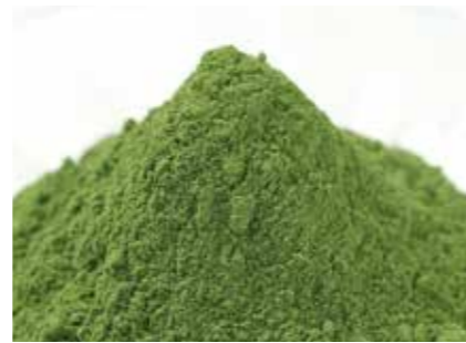
わさび 乾燥わさび(茎・葉) DRIED WASABI (STEM, LEAVES) ●産地/インドネシア・中国 ●荷姿/2kg × 5/カートン

新鮮な本わさびの茎をカットし、塩蔵冷凍。シャキシャキした食感でタコわさびやわさび漬け、お茶漬けの具に。