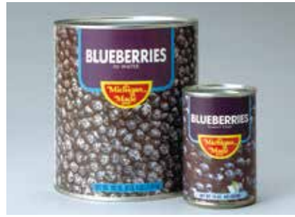
缶詰 ブルーベリー BLUE BERRY ●産地/アメリカ ●荷姿/4号缶・1号缶 各種洋菓子に最適です。