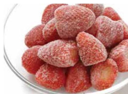
冷凍果実 ストロベリー STRAWBERRY ●産地/アルゼンチン・モロッコ・ポーランド他 ●荷姿/各種 各国より厳選したものを取り揃えています。