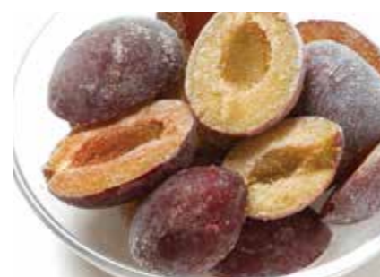
冷凍果実 プルーン PRUNE ●産地/セルビア ●荷姿/各種 ヨーグルトやジュースに最適です。