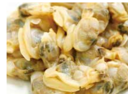
加工食品 冷凍 あさりむき身 FROZEN PEELED SHORT-NECKED CLAM ●産地:中国 ●荷姿:1kg×10袋/箱 洗浄選別方法にこだわり、安心してご利用頂けるようX線検査機を使用しております。