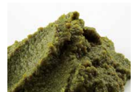
とうがらし 塩蔵冷凍青唐辛子 SALTED FROZEN GREEN CHILI ●産地/インドネシア ●荷姿/2.5kg × 4/カートン

安心・安全な原料を使用して、フレーク・コース・パウダー・ロースト品を生産しています。