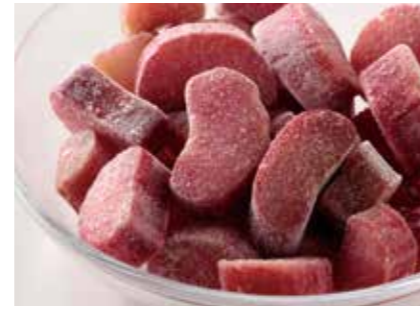
冷凍果実 ルバーブ RHUBARB ●産地/アメリカ ●荷姿/各種 希少な赤ルバーブを厳選しました。