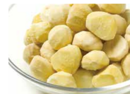
ナッツ類 むき栗 PEELLED CHESTNUTS ●産地/中国 ●荷姿/各種 炊き込みご飯等に最適です。