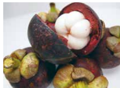
生鮮果実 マンゴスチン MANGOSTEEN ●産地/タイ ●荷姿/各種 果物の女王と称され、強い甘みと爽やかな酸味をもつ上品な味わいです。