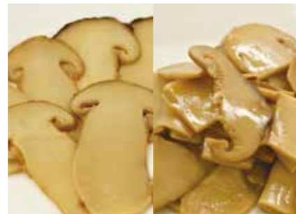
加工食品 松茸 水煮・塩蔵等各種 BOILED/SALTED MATSUTAKE MUSHROOM FOR COOKED RICE ●産地/中国 ●荷姿/各種 炊き込み、混ぜ込み、容量などご希望に合わせて加工致します。