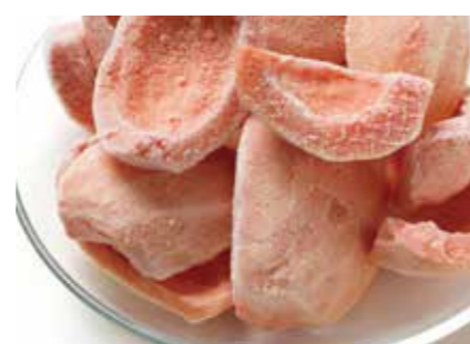
冷凍果実 ピンクグアバ PINK GUAVA ●産地/インドネシア ●荷姿/各種 きれいなピンク色が特徴で、ジュース等、様々な用途にご利用いただけます。