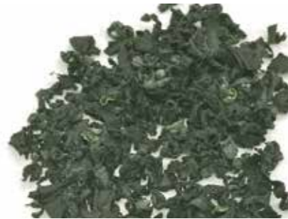
加工食品 乾燥カットわかめ DRIED SEAWEED ●産地:中国 ●荷姿:各種 厳選した原料を専門の工場にて加工しています。

きのこ、山菜、水産品を中心に加工原料を取扱っています。なかでも、松茸の塩蔵・水煮はお客様に高い評価をいただいております。これからもお客様のご要望に応じた商品を提供してまいります。