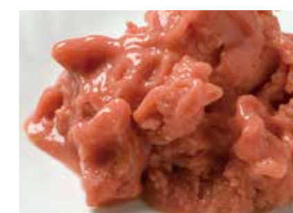
冷凍果実 ピンクグアバクラッシュ PINK GUAVA PASTE ●産地/インドネシア ●荷姿/各種 きれいなピンクが特徴で、様々な用途にご対応します。