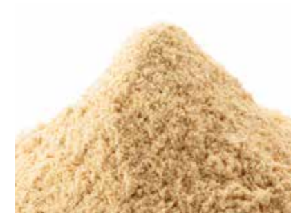
生姜 乾燥生姜加工品 DRIED GINGER PRODUCTS ●産地/中国 ●荷姿/各種

中国・遼寧省とインドネシアでの自社栽培・自社加工により、農業管理やトレーサビリティの保証を実現しております。