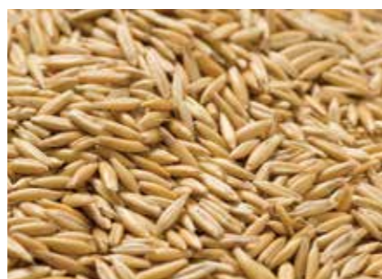
燕麦 OATS ●産地 / カナダ・オーストラリア・アメリカ ●品種 / DROS・MD / FD OATS 各種オーツの輸入を行っています。競走馬用加工燕麦や乳用牛飼料用燕麦などを取り扱っています。