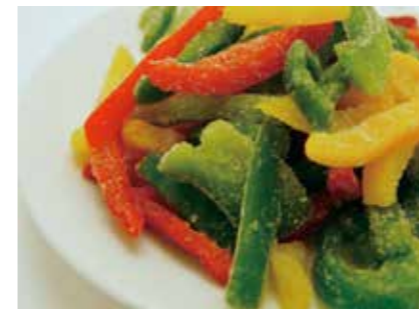
冷凍野菜 パプリカ PAPRIKA ●産地:ポーランド ●荷姿:各種 スライス、ダイスカット等、用途に合わせて品揃えています。