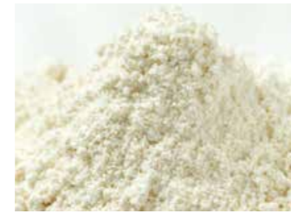
タピオカ澱粉(各種加工澱粉) MODIFIED TAPIOCA STARCH ●産地/タイ産 ●荷姿/各種(25kgPP・フレコンなど) タイ産の高品質な加工澱粉で、用途に合わせて各種加工が可能です。食感改善、粘度付与、冷凍耐性、保水性向上等、食品加工全般に使用されています。