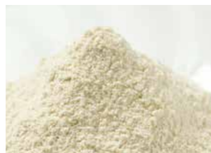
小麦グルテン WHEAT GLUTEN ●産地 / オーストラリア・カナダ・アメリカ ●荷姿 / 20kg 袋入り・25kg 袋入り 活性小麦グルテンや加工グルテンの輸入を行っています。小麦粉の麩質調整等にご利用頂いております。