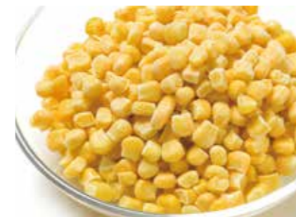
冷凍野菜 スイートコーン SWEET CORN ●産地/アメリカ ●荷姿/各種 甘みの強いコーンを厳選しました。