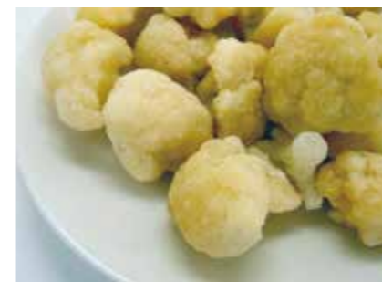
冷凍野菜 カリフラワー CAULIFLOWER ●産地:ポーランド ●荷姿:各種 カットサイズは用途に合わせて品揃えています。