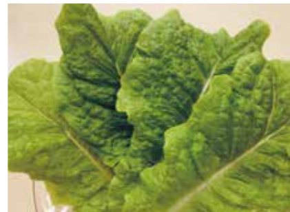
生鮮野菜 サンチュ KOREAN LETTUCE ●産地/日本 ●荷姿/各種 サラダや焼肉等、様々な用途にご利用いただけます。