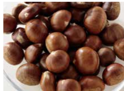
ナッツ類 生鮮栗 CHESTNUT ●産地/中国 ●荷姿/各種 中国河北省の中でも最高品質を誇る青龍県産を輸入しております。