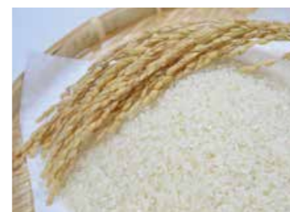
輸出米 (日本米・カリフォルニア米・イタリア米 etc) ●産地 / 日本・米国・イタリア ●荷姿 / 各種 厳選された美味しいお米です。世界の方々に至福のひとつをお届けします。