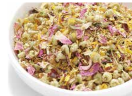
スパイス・ハーブ ハーブ HERB ●産地/世界各地 ●荷姿/各種 料理用・ハーブティ用・抽出用など高品質のハーブを世界各地から輸入しています。選別、ブレンド、レシピ提案などもご対応します。