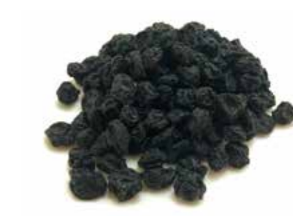
ドライフルーツ ブルーベリー DRIED BLUEBERRY ●産地:中南米 ●荷姿:11.34kg 大粒のカルチブルーベリーを使用しております。