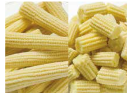
冷凍野菜 ヤングコーン YOUNG CORN ●産地/タイ ●荷姿/各種 ホール、スライス等、用途に合わせて品揃えています。