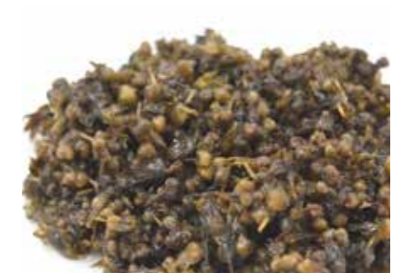
加工食品 塩蔵 紫蘇の実 SALTED PERILLA SEED ●産地:中国 ●荷姿:25kg/箱 佃煮、惣菜など様々な用途にご利用頂けます。