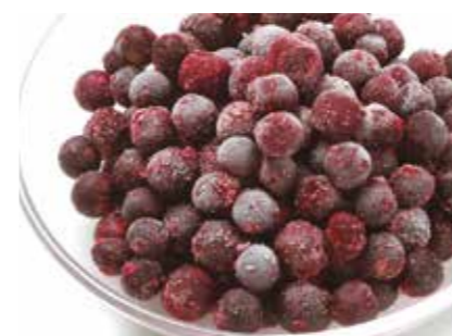
冷凍果実 ブラック カラント BLACK CURRANT ●産地/ポーランド ●荷姿/各種 アイスクリーム、ヨーグルト等、様々な用途にご利用いただけます。