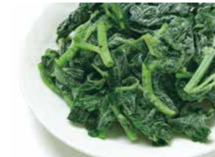
冷凍野菜 モロヘイヤ MULUKHIYYA ●産地/タイ・インドネシア ●荷姿/各種 栄養価が豊富で、「王様の野菜(ムルキーヤ)」と呼ばれています。