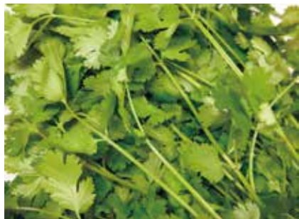
生鮮野菜 有機パクチー CORIANDER ●産地/日本 ●荷姿/各種 風味豊かな有機パクチーです。