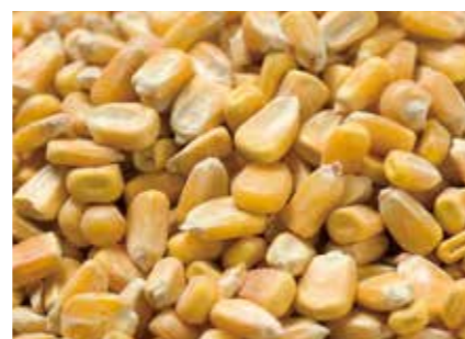
コーン CORN, MAIZE ●産地 / アメリカ・中国・アルゼンチン ●品種 / US3YC 配合飼料の原料としてのデントコーン / グレインソルガム / マイロの輸入を行っています。