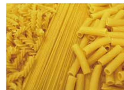
パスタ PASTA ●産地 / イタリア ●荷姿 / 500g・5kg 厳選されたイタリア産デュラム小麦のみを原料にした有機パスタです。