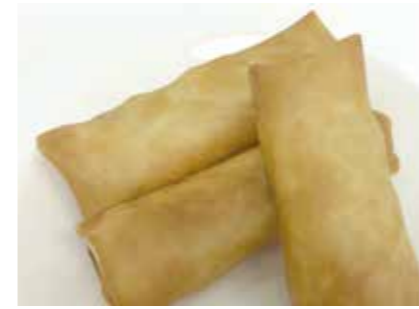
加工食品 春巻・ちまき SPRING ROLL, CHIMAKI ●産地:中国 ●荷姿:各種 加熱調理済みの商品です。