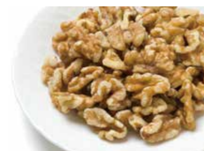
ナッツ類 クルミ WALNUTS ●産地/アメリカ・チリ ●荷姿/各種 製パン・洋菓子や和物等に最適です