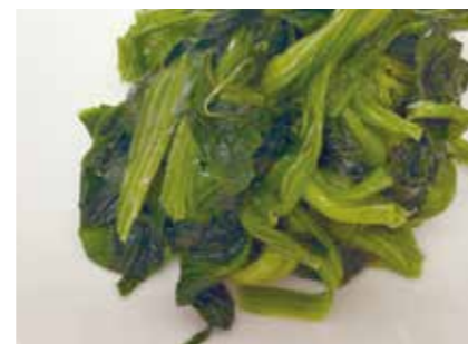
冷凍野菜 ホウレンソウ SPINACH ●産地:中国 ●荷姿:1kg x 10 解凍してご利用ください。様々な用途にご利用いただけます。