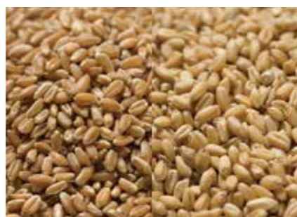
小麦 WHEAT ●産地 / アメリカ・カナダ・オーストラリア ●品種 / 1CW・DNS・HRW・ASW・WW 麦の輸入を行っています。現地で駐在員が品質確認と船積立会いを行います。