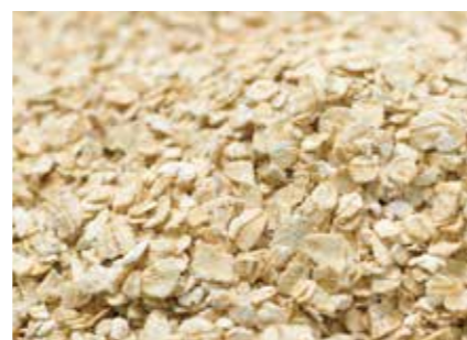
オーツフレーク OAT FLAKES ●産地 / カナダ・オーストラリア・アメリカ ●荷姿 / 22.7kg 袋入り オートミールやシリアルバー、調理パンのトッピング等にご利用いただけます。