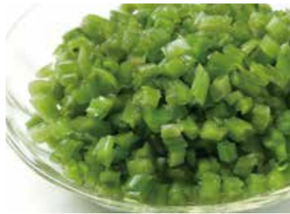
わさび 塩蔵冷凍わさび茎 FROZEN SALTED WASABI STEM ●産地/インドネシア・中国 ●荷姿/5kg × 4/カートン

自社栽培した安心・安全な本わさびを、天然の風味・辛味をそのままに根・茎・葉を冷凍加工しました。