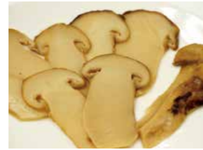
加工食品 水煮 塩蔵 松茸Sサイズ BOILED/SALTED MATSUTAKE MUSHROOM SIZE-S ●産地:中国 ●荷姿:各種 炊き込みご飯等に最適です。