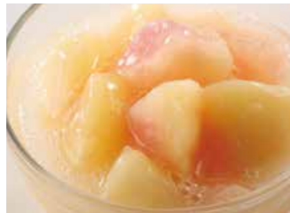
冷凍果実 白桃カット&ソース WHITE PEACH CUT & SAUCE ●産地/中国 ●荷姿/300g×30袋 アイスクリームやタルトのトッピングとしてそのままお使いいただけます。