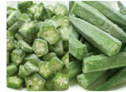
冷凍野菜 オクラ OKRA ●産地/タイ・インドネシア ●荷姿/各種 ホール、スライス等、用途に合わせて品揃えています。