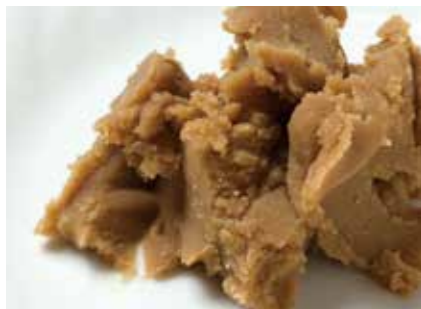
ナッツ類 焼き甘栗ペースト CHESTNUTS PASTE ●産地/国産(原料は中国) ●荷姿/各種 洋菓子や和菓子に最適です。