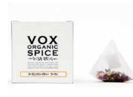
ヴォークス・スパイス VOX SPICE OEM・業務用 ●産地/世界各地 ●荷姿/各種 オーガニックスパイス・ハーブのワンストップショップ。多様なニーズに対応する原料調達・製造・企画・商品提案が可能です。