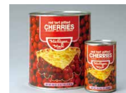
缶詰 サワーチェリー RED SOUR CHERRY ●産地/アメリカ ●荷姿/4号缶・1号缶 各種洋菓子に最適です。