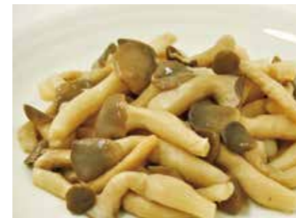
加工食品 水煮 平茸(しめじ) BOILED HIRATAKE(SHIMEJI)MUSHROOM ●産地:中国 ●荷姿:各種 佃煮、惣菜など様々な用途にご利用頂けます。