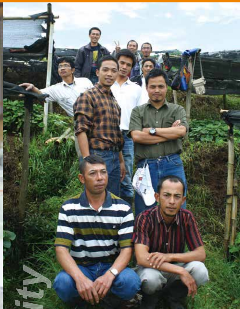
トレーサビリティ

専門性と技術力を持つゼネラリストへ、そしてメーカー機能を持つ商社へ。私たちは、この目標を実現させていくため、国内外に開発拠点を設けることを積極的に進めてきました。そのヴォークス・トレーディングならではの独自の体制で、新商品の開発から食材の品質の維持向上まで、時代のニーズに応える確かな食の在り方を提案、「安心食材」の「安定供給」を、実現させてきました。