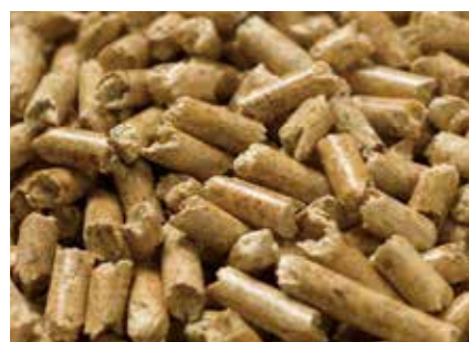
ウッドペレット WOOD PELLETS ●産地 / カナダ ●荷姿 / バラもしくは各種袋詰め 衛生性に優れ、吸湿力が高いため、競走馬や肉用、乳用牛の牛舎の敷床に最適です。