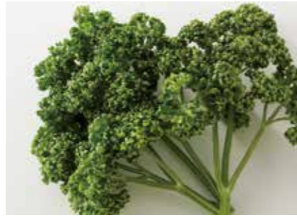
生鮮野菜 有機パセリ ORGANIC PARSLEY ●産地/日本 ●荷姿/各種 有機栽培による貴重なパセリです。えぐみが少なく料理のお供に最適です。