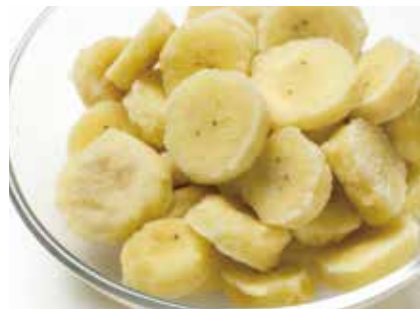
冷凍果実 バナナ BANANA ●産地/エクアドル・タイ ●荷姿/各種 様々な用途にご利用いただけます。