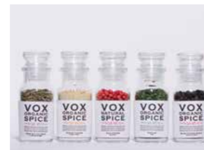
ヴォークス・スパイス VOX SPICE ●産地/世界各地 ●荷姿/瓶、袋 有機栽培のスパイス・ハーブを、キッチンが華やぐ上質なパッケージに入れました。ギフトにも。 www.voxspice.jp