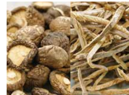
加工食品 乾燥 椎茸(ホール・スライス) DRIED SHIITAKE MUSHROOM(WHOLE/SLICE) ●産地:中国 ●荷姿:各種 用途に合わせてサイズ提案致します。