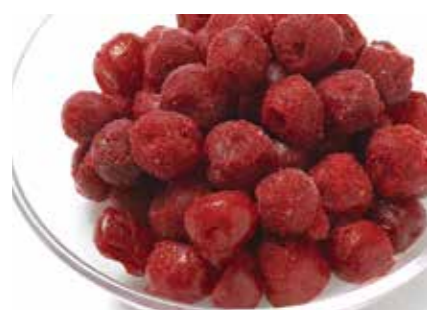
冷凍果実 サワーチェリー SOUR CHERRY ●産地/トルコ・ポーランド他 ●荷姿/各種 爽やかな酸味が特徴です。