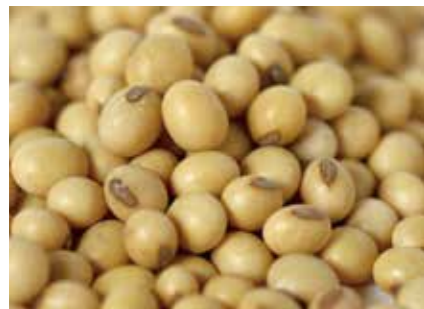
豆類 大豆 SOY BEANS ●産地/中国・アメリカ・カナダ ●荷姿/各種 中国・アメリカ・カナダより、主に豆腐、味噌、煮豆用の食品大豆を輸入しています。