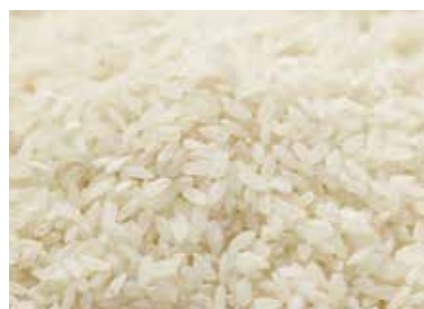
米 RICE ●産地 / アメリカ・中国・タイ・オーストラリア ●品種 / 短粒種・中粒種・長粒種・各種精米玄米 米穀の輸出入を行っています。契約栽培承ります。また現地で駐在員が品質確認と船積立会いを行います。

明治、大正、昭和、平成と現在に至る 100 余年の経験とノウハウと国内外のネットワークを生かし、世界の穀物を日本のお客様へお届けしています。日本の穀物であるお米の輸出や国産小麦粉の輸出に力を入れており、日本の畜産業を支える配合飼料の原料はもとより、畜産経営に不可欠なユニークな農業資材を取り扱っています。製麺、製パン、製菓原料に加え、水畜産加工品などの原料として幅広くご利用頂いている小麦派生の商品を取り扱っています。海外の現地法人・駐在員事務所とのチームワークで、24 時間、365 日体制で稼働しています。 ※当社は米・麦の農林水産省指定輸入商社かつ輸入食糧協議会会員です。