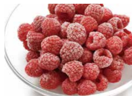
冷凍果実 ラズベリー RASPBERRY ●産地/チリ・アメリカ・ポーランド・セルビア他 ●荷姿/各種 各国より厳選したものを取り揃えています。