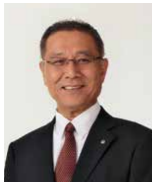
株式会社 ヴォークス・トレーディング 代表取締役社長

私たちは、時代を先取りするフード・エンジニアリング商社。 つねに、新たな「食」の可能性に挑み続けています。