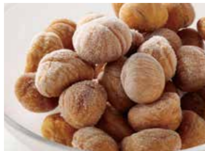
ナッツ類 冷凍焼きむき甘栗 ROASTED PEELED CHESTNUT ●産地/中国 ●荷姿/各種 中国河北省東部の燕山山脈一帯で収穫される原料を使用しております。