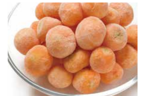
冷凍野菜 パリジャンキャロット PARISIAN CARROT ●産地/ベルギー ●荷姿/各種 丸い形が特徴です。