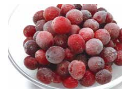
冷凍果実 クランベリー CRANBERRY ●産地/アメリカ ●荷姿/各種 粒が揃った厳選品です。