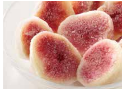
冷凍果実 イチジク FIG ●産地/中国 ●荷姿/各種 使いやすいサイズにカットしてあります。