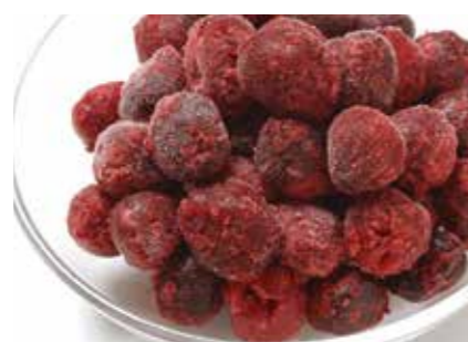
冷凍果実 ダークスウィートチェリー DARK SWEET CHERRY ●産地/トルコ・ポーランド他 ●荷姿/各種 深い赤色と強い甘み特徴です。