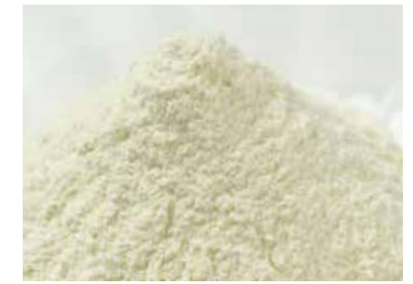
たまねぎ オニオンパウダー ONION POWDER ●産地/中国 ●荷姿/10kg × 2/カートン

安心・安全な原料を使用して、フレークとパウダーを生産しています。用途はソース、シーズニング、たれ等の原料に。