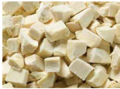
ホースラディッシュ(西洋わさび) 冷凍ホースラディッシュ FROZEN HORSERADISH ●産地/中国 ●荷姿/5kg × 3/カートン

すりおろした本わさびをお蕎麦やお刺身、肉料理と召し上がって頂くことにより、天然の辛味・風味と、清涼感が楽しめます。