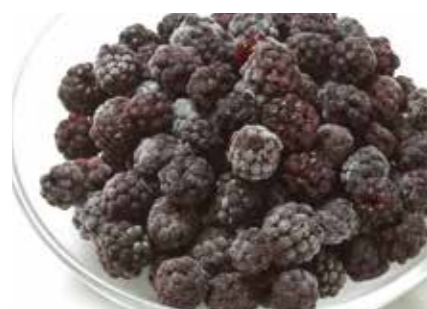
冷凍果実 ブラックベリー BLACKBERRY ●産地/チリ・ポーランド ●荷姿/各種 甘みの強い野生種を使用しています。