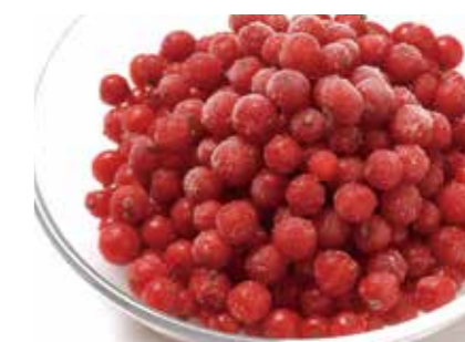
冷凍果実 レッド カラント RED CURRANT ●産地/ポーランド ●荷姿/各種 アイスクリーム、ヨーグルト等、様々な用途にご利用いただけます。