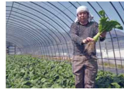
こだわり農産物 HIGH-QUALITY PRODUCTS ●産地/九州島内をメインに国内各県産 ●荷姿/各種 九州内の産地ネットワークにより、差別化した野菜類を栽培、調達します。ご要望に応じて、下処理・冷凍・乾燥など各種加工のアレンジも可能です。

地域特性を十分に考慮しつつ、お客様と密接に関わり、ニーズにしっかりと応えた商品開発を行っています。大葉などの生鮮野菜、ゆず関連製品等、飼料原料、タピオカ澱粉などを取り扱っています。