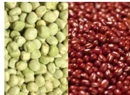
豆類 雑豆(えんどう・いんげん・小豆・そら豆) PEA, STRING BEANS, SMALL RED BEANS, BROAD BEANS ●産地/世界各地 ●荷姿/各種 中国産えんどう・いんげん・小豆・そら豆を中心に取り扱い扱っています。