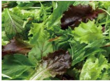
生鮮野菜 ベビーリーフ BABY LEAF ●産地/日本 ●荷姿/各種 サラダ等、様々な用途にご利用いただけます。