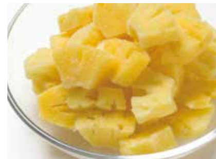
冷凍果実 パイナップル PINEAPPLE ●産地/タイ ●荷姿/各種 洋菓子やジュースに最適です。