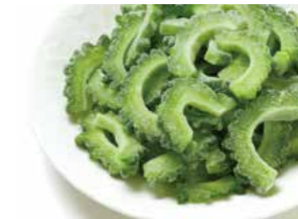
冷凍野菜 ゴーヤ BITTER GURD ●産地/タイ ●荷姿/各種 濃い緑色が特徴です。