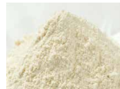
にんにく 乾燥にんにく加工品 DRIED GARLIC PRODUCTS ●産地/中国 ●荷姿/10kg × 2/カートン

山東省で契約栽培した原料を遼寧省の関連工場にて加工。お客様のご要望に沿って、商品開発・生産を行っております。