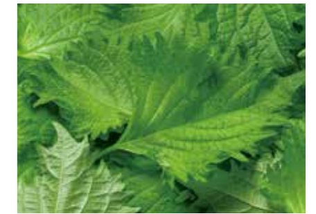
生鮮大葉、乾燥大葉、冷凍大葉ミンチ PERILLA(SHISO) ●産地/長崎産(農薬を使用しない栽培) ●荷姿/各種(小袋・トレイ・バラなど) 安心・安全にこだわり、農薬を使用せずに栽培した大葉です。一般的な大葉に比べ、香り成分が豊富で、残留農薬のえぐみもなく、大変美味です。