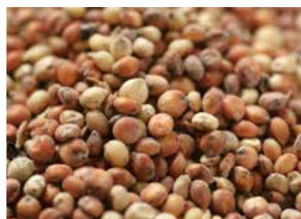
マイロ GRAIN SORGHUM, MILO ●産地 / アメリカ・アルゼンチン・オーストラリア ●品種 / US2GS 配合飼料の原料としてのグレインソルガム / マイロの輸入を行っています。