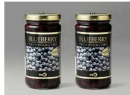
缶詰 ブルーベリー BLUE BERRY ●産地/アメリカ ●荷姿/368g×12本 弊社独自のPB商品です。