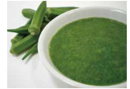
冷凍野菜 オクラとろろ OKRA PASTE ●産地/タイ・インドネシア ●荷姿/各種 練り込み、トッピングとして使いやすいなめらかなペーストです。