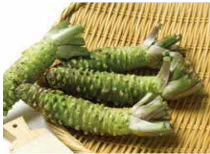
わさび 冷凍わさび(根・茎・葉) FROZEN WASABI (ROOT, STEM, LEAVES) ●産地/インドネシア・中国 ●荷姿/5kg × 3/カートン

自社栽培した安心・安全な本わさびを、天然の風味・辛味をそのままに根・茎・葉を冷凍加工しました。