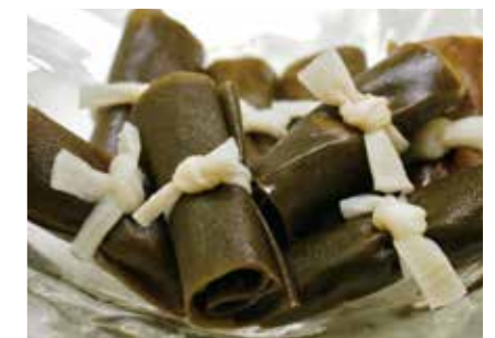
加工食品 冷凍 昆布巻 FROZEN ROLLED SEAWEED ●産地:中国 ●荷姿:各種 一口巻から太巻までご要望に応じて手巻きで加工致します。