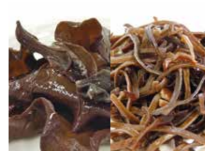
加工食品 乾燥 木耳(ホール・スライス) DRIED FUNGUS(WHOLE/SLICE) ●産地:中国 ●荷姿:各種 用途に合わせてサイズ提案致します。