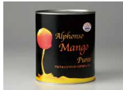
缶詰 マンゴーピューレ MANGO PUREE ●産地/インド ●荷姿/1号缶・バッグインボックス プリン、ソース、シャーベット等、色々な用途にお使いいただけます。