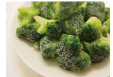
冷凍野菜 ブロッコリー BROCCOLI ●産地:ポーランド ●荷姿:各種 カットサイズは用途に合わせて品揃えています。