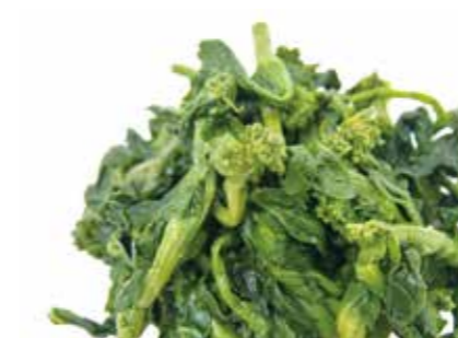
加工食品 水煮 菜の花 BOILED CANOLA FLOWER ●産地:中国 ●荷姿:1kg×12袋/箱 彩り、トッピング等にご利用頂きます。