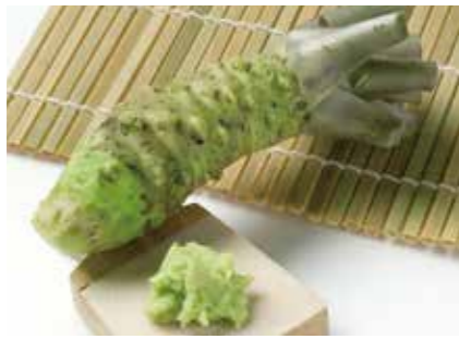
わさび 生鮮わさび根 FRESH WASABI ROOT ●産地/インドネシア・中国 ●荷姿/1kg × 6/カートン

本わさびの茎や葉を乾燥加工。用途はふりかけやお茶漬けの具、お菓子のパウダー、天然の着色料として。