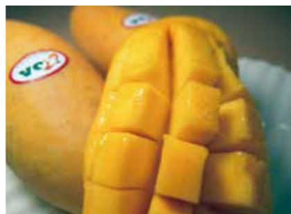
生鮮果実 マンゴー (ナムドックマイ・マハチャノック) MANGO ●産地/タイ ●荷姿/各種 芳醇な香りと濃厚な甘みが楽しめる口当たり滑らかなタイ産マンゴーです。