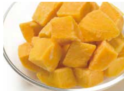
冷凍果実 マンゴー MANGO ●産地/タイ・メキシコ・インド・南米他 ●荷姿/各種 各国より厳選したものを取り揃えています。