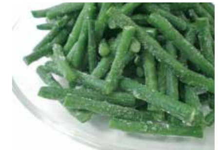
冷凍野菜 ササゲ COWPEA BEAN ●産地/タイ・インドネシア ●荷姿/各種 鮮やかな緑とやわらかい食感が特徴です。