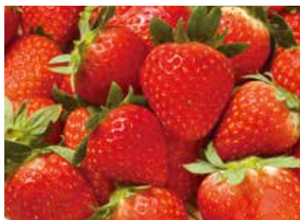
生鮮果実 イチゴ STRAWBERRY ●産地/日本 ●荷姿/各種 ステビア農法による甘いイチゴです。