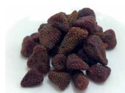
ドライフルーツ ストロベリー DRIED STRAWBERRY ●産地:北米・中南米 ●荷姿:11.34kg 果実本来の味をご堪能いただけます。