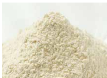
小麦粉 WHEAT FLOUR ●産地 / 国産 ●荷姿 / 25kg 袋入り 強力、中力、薄力粉や各種ミックス粉を取り扱っています。小麦粉の輸出を行っています。