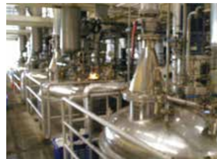
エッセンシャルオイル マスタード ESSENTIAL OIL ●産地/タイ ●荷姿/20kg/カートン 当社自ら手配した原料を使用し、タイの自社工場で製造した高品質の天然精油です。