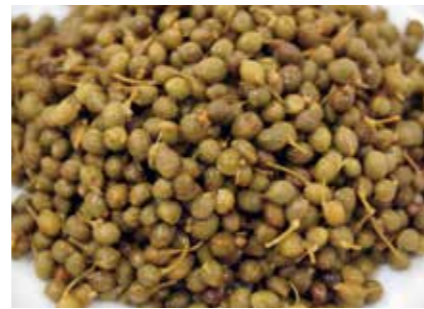
加工食品 塩蔵 山椒の実 SALTED JAPANESE PEPPER SEED ●産地:韓国 ●荷姿:各種 産地を厳選した色や風味にこだわった原料です。