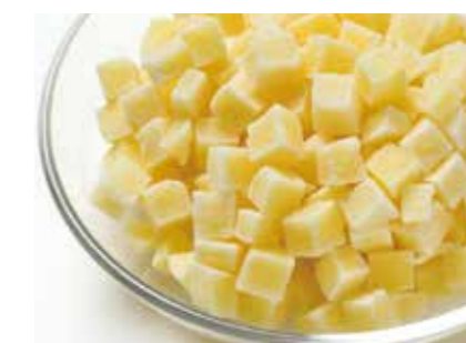
冷凍野菜 ダイスカットポテト DICED POTATO ●産地/中国 ●荷姿/各種 サラダやガロニー等、用途は色々です。