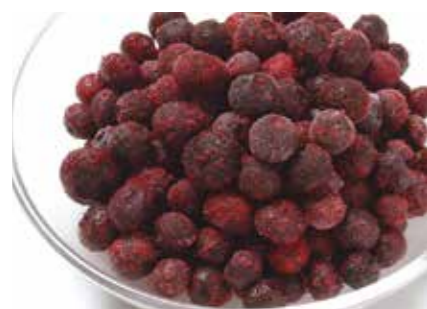
冷凍果実 ブルーベリー BLUEBERRY ●産地/アメリカ・カナダ・チリ ●荷姿/各種 栽培品種は青紫色で、生食用の他、ジャム等の加工食品として利用されます。視力改善効果が期待されるアントシアニンが豊富に含まれ人気があります。